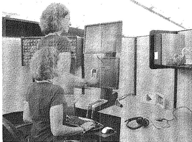
מעמד לעבודה בעמידה. "מי בכלל צריך שולחן?"

רשתות שיווק לכפות על עובדים להעביר את המשמרת בעמידה, גם הקופאים בסופרמרקט, שנדרשו לעמוד במשך שעות רבות בכל יום, עברו לשיבה. השינויים הרדמטיים שהתחוללו בכלכלה העולמית מפרוץ המאה ה-20 ועד היום יצרו חברה שבה רבים הסיכויים שהעבודה שלנו היא במגזר השירותים או במגזר הציבורי, דבר שמחזיר אותנו לאותה הנקודה - כיסא מול שולחן. השאלה היא כיצד מתקרמים מפה.